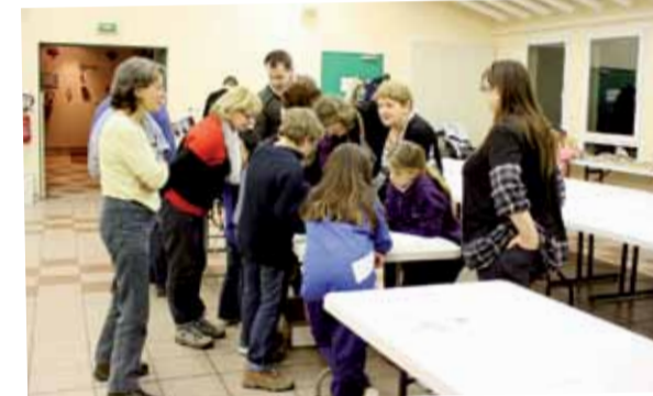
«9e nuit de la chouette» le samedi 19 mars organisée par l'association Connaître et Protéger la Nature, le temps de découvrir l'univers de ces rapaces