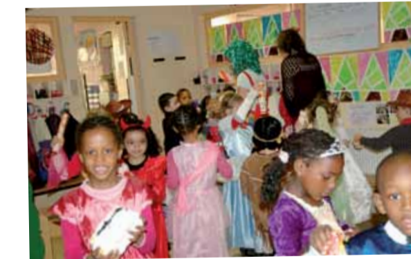
Les élèves de l'école élémentaire Moulin-Fleuri ont fêté le carnaval le 25 mars. Des costumes tout en couleurs et en imagination.

Festival « Faîtes des courts » : À l'issue du 7e festival de courts métrages organisé les 2 et 3 avril au cinéma municipal les 4 vents par l'association Iris, le Prix du Public est revenu au film «L'accordeur» d'Olivier Treiner récompensé d'une somme de 300€ accordée par la municipalité. 27 œuvres étaient en compétition sur les différentes sessions dont 2 courts proposés par les élèves des collèges Georges-Brassens et Arthur-Chaussy.