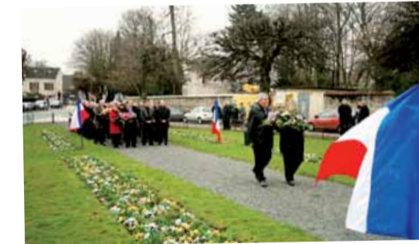
Dépôt de gerbes lors de la cérémonie du 19 mars à l'occasion du 49e anniversaire de la fin de la guerre d'Algérie, organisée par la FNACA.

Musiques à Brie 2011 : succès sur toute la gamme ! Les mélomanes ont adoré l'édition 2011 du festival Musiques à Brie. Depuis la soirée celtique inaugurale de la Saint-Patrick jusqu'au concert classique de clôture sous la baguette d'Ostinato, le succès est resté au rendez-vous. De la musique pour tous les goûts donc, allant du jazz de la meilleure facture servie par la formation de Didier Lockwood, jusqu'au rock revival du week-end Sixties Nostalgie sans oublier quelques sessions de musiques actuelles, on peut vraiment dire que l'éclectisme était au programme. Et pour élargir encore la cible, citons aussi l'expo des photos d'artistes yéyé de Jean-Marie Périer, les incroyables juke-boxes et les flamboyantes CG amenées par Eric Kus et l'amicale Chappe et Gessalin en souvenir du constructeur briard de voitures de sport. Une production signée par la direction des affaires culturelles de la ville. Rendez-vous dans 2 ans.